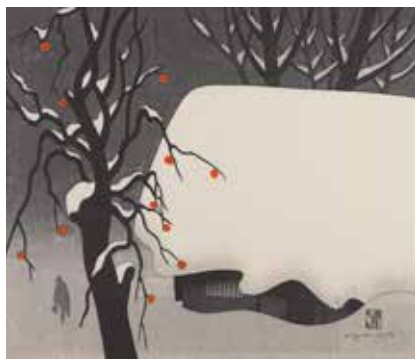
《会津の冬(50) 柳津》1981年 ©Hisako Watanabe