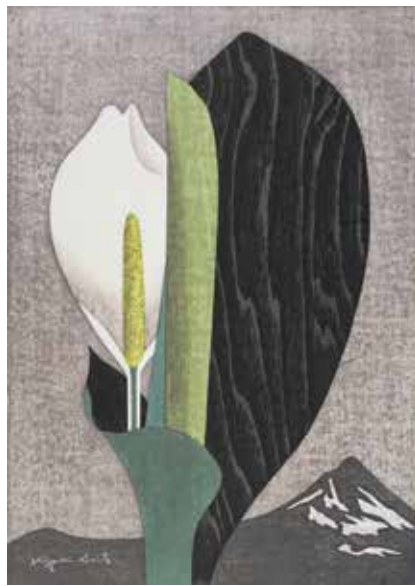
《春粧(2)》1989年 ©Hisako Watanabe

本展では、作者の初期から晩年までの作品・資料を一堂に展示。日本の伝統表現に西洋の近代造形を取り入れた魅力あふれる作品世界を紹介します。