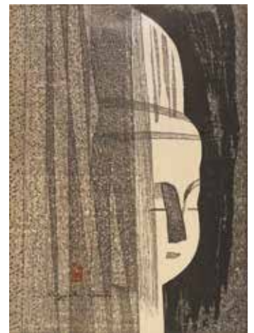
《仏陀(3)》1962年 ©Hisako Watanabe