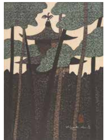
《金閣寺 京都》1967年 ©Hisako Watanabe