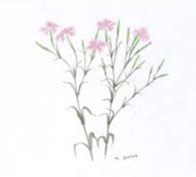
「みちの辺の花」より「かわらなでこ」 ©空想工房