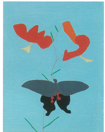
《鬼百合に揚羽蝶》1959年, 油彩・紙(画布に貼る) (東京国立近代美術館蔵)