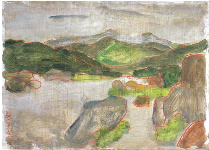
《山形風景》1936年, 油彩・板 (公益財団法人 熊谷守一つかけ記念館蔵)